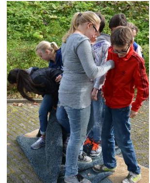
Enkele jongere deelnemers met het kleed. Samenwerken, iedereen kan het... [foto's vredeseducatie]